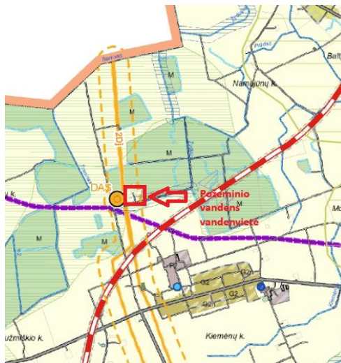
1 pav. Ištrauka iš Pasvalio rajono bendrojo plano.

Teritorijoje parengtas Pasvalio rajono bendrasis planas, teritorija patenka į žemės ūkio teritorijų zonas.